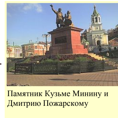
Памятник Кузьме Минину и Дмитрию Пожарскому

Этот день по праву называют Днем народного единства. Другого такого дня в русской истории не было.